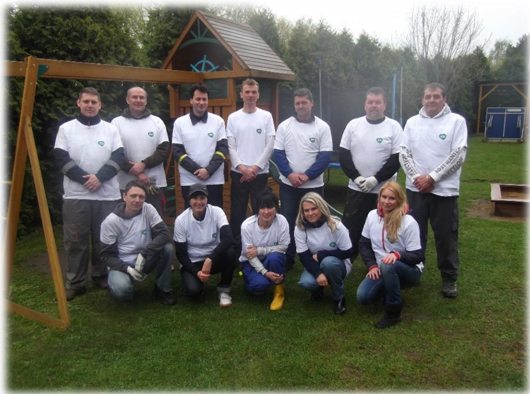
Spolupráce dvou organizací: dětský domov a Unipetrol