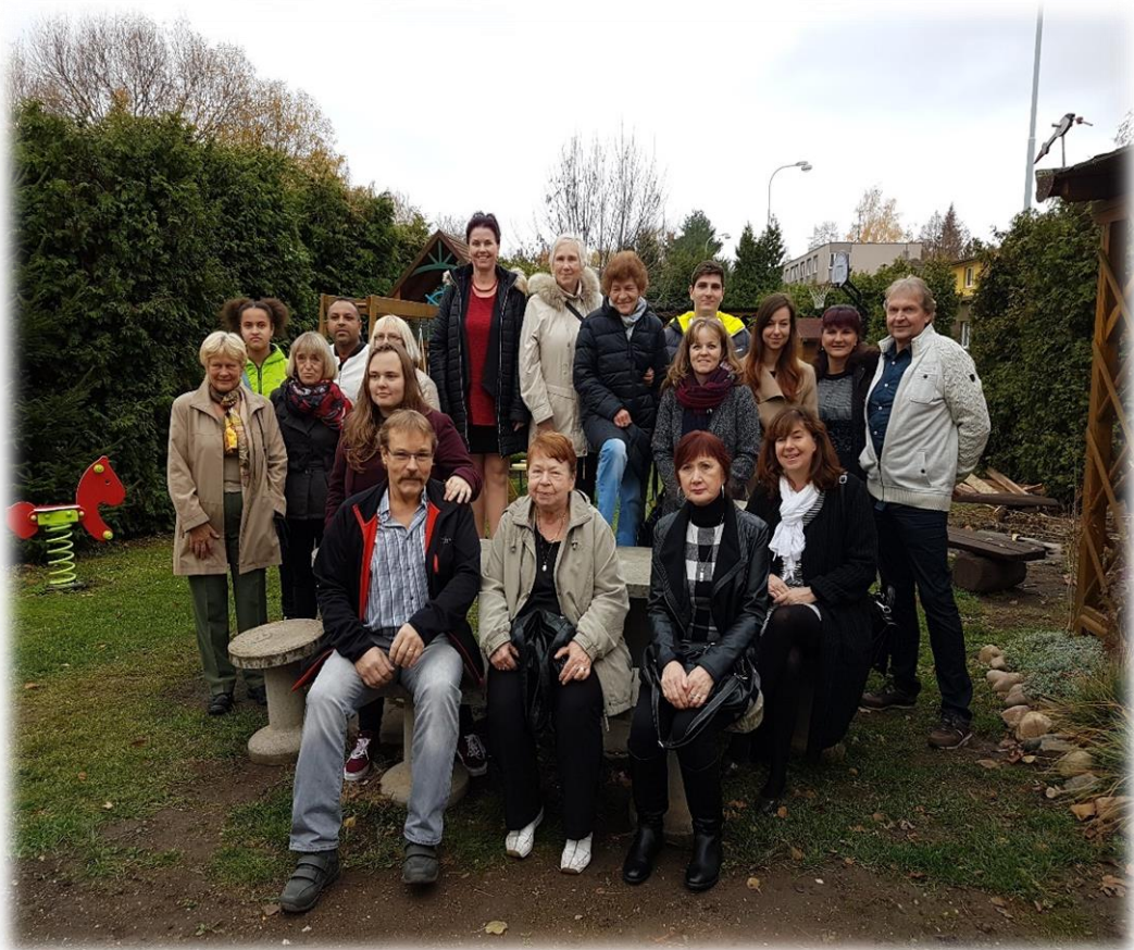
Návštěva bývalých dětí -2018

Lidé jsou často nerozumní, nelogiční a sobečtí. Přesto jim odpusťte. Budete-li k nim laskaví, stejně vás obviní ze sobectví a nízkých motivů. Zůstaňte laskaví. Budete-li úspěšní, získáte některé falešné přátele a opravdové nepřátele. Přesto pokračujte. Budete-li upřímní a čestní, lidé vás podvedou, vy ale zůstaňte upřímní a čestní. Strávíte-li léta budováním něčeho, co vám jiný zničí přes noc, budujte znovu. Naleznete-li štěstí, klid a mír, budou vám závidět. Zůstaňte šťastní. Na dobro, které uděláte dnes, zítra lidé zapomenou. Přesto dál dělejte dobro. Dávejte světu to nejlepší, co je ve vás, a i když to nemusí stačit, přesto dávejte dál.